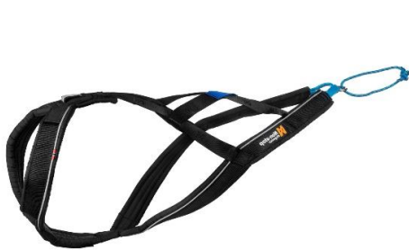
Nansen Nome Harness 5.0 X-Back Zuggeschirr von Non-stop Dogwear

Damit der Hund keine Probleme des Bewegungsapparates bekommt soll das Zuggeschirr passen Hersteller: Non-stop, Zero DC, Dragatan Empfehlung: Nansen Nome Harness X-Back oder Free Motion Harness H-Back Zuggeschirr von Non-stop Dogwear, Faster Zero DC Renn- und Zuggeschirr