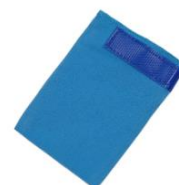
LONG DISTANCE BOOTIE