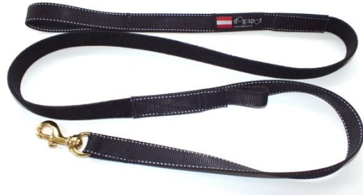
Jöringleine für Canicross aus Gurtband und Flachgummigurtband