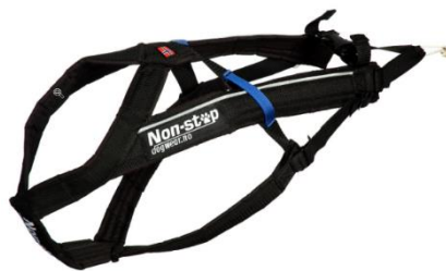
Free Motion Harness H-Back Zuggeschirr verstellbar von Non-stop Dogwear