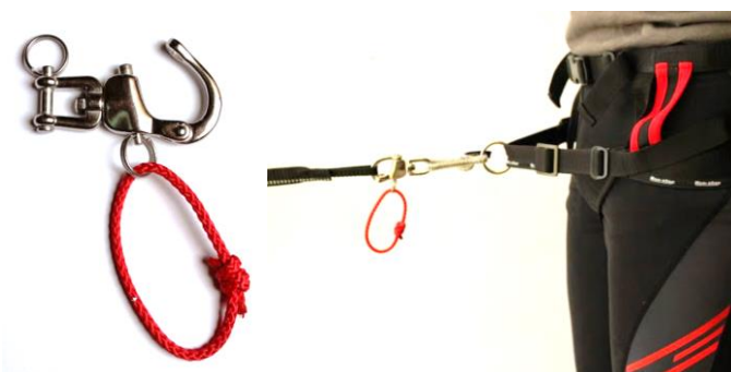
Paniksnap mit Wirbelgabel inklusive Reißleine (keine Pflicht) von Non-stop Dogwear

Hersteller & Empfehlung: Non-stop Dogwear