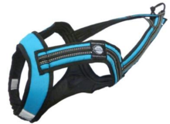
Zero DC Renn- und Zuggeschirr

Wie misst man einen Hund richtig für ein Zuggeschirr (Finn)