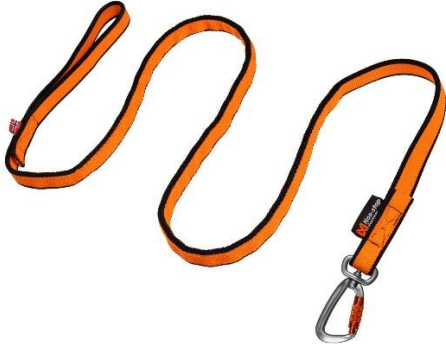
Bungee Line von Non-stop Dogwear

Empfehlung: Bungee Running Line von Non-stop Dogwear (2m ausgezogen), Jöringleine für Canicross (2m ausgezogen)